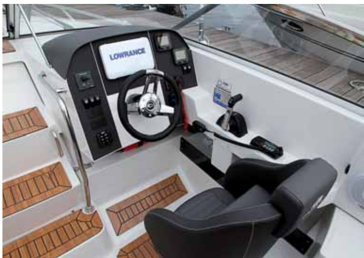
Пост управления оборудован просто, но со знанием дела

отметить, что при продуманности эргономики и хорошем качестве исполнения деталей AMT 230DC заметно стремится к простоте оборудования. Настилы из водостойкого ламината в кокпите и носовой палубе имитируют тиковую рейку. Сливные шпигаты – просто отверстия в водостоках без манерных хромированных фитингов. Строителей не смущают резаные и окрашенные края пластиковых секций. Открытые крышки люков удерживаются не газовыми пружинами, а обычными капроновыми лентами с кнопками, и даже массивная скользящая дверь носовой каюты сдвигается в сторону с помощью такой же капроновой петли. Без излишеств устроена сама каюта – аккуратно зашитая изнутри мягкими виниловыми панелями и фанеркой крышек отсеков для личных вещей, она не отягощена красотами вроде занавесочек на иллюминаторах или накладок из массива ценных пород. Зато штатные замки, застежки и петли выглядят добротно – хромированные, крупные. Аккуратно пошиты подушки с фир-