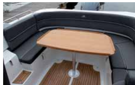
Кормовую часть кокпита AMT 230DC можно превратить в лежанку-солярий и в уголок для застолья